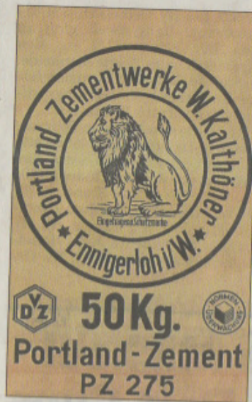
Ein Löwe als Markenzeichen schmückt dieses Exemplar.