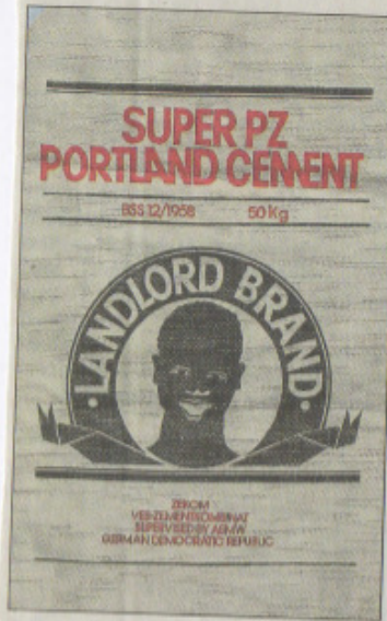
Aus dem Jahr 1958 stammt dieser Portland-Cement-Sack.