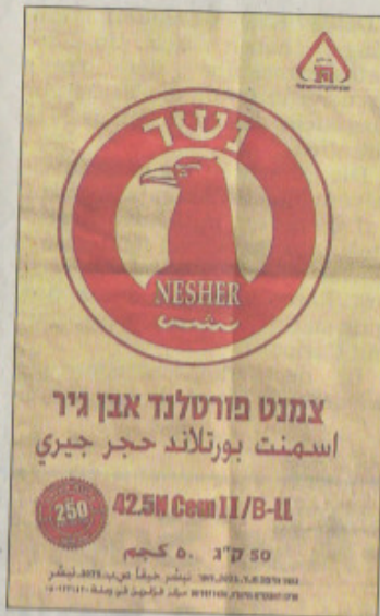
In arabischen Schriftzeichen wird auf diesem Sack informiert.