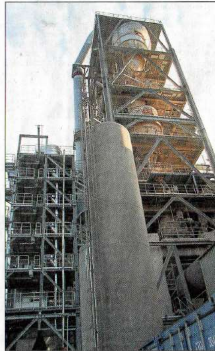
Wahrzeichen: Der Wärmetauscherturm der Phoenix Zementwerke ist schon von Weitem zu sehen. Direkt daneben baut das Unternehmen einen Katalysator.

In den Zementmühlen wird der sogenannte Portlandzementklinker unter Zugabe von Gips zu Portlandzement gemahlen. Seinen Namen verdankt er der Halbinsel Portland im Süden Englands.